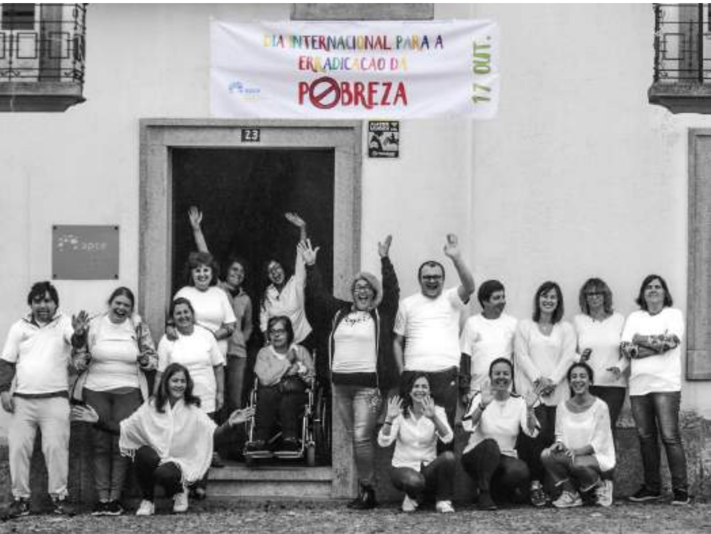
Colaboradores e Clientes da APCE, #DIABRANCO, 2019