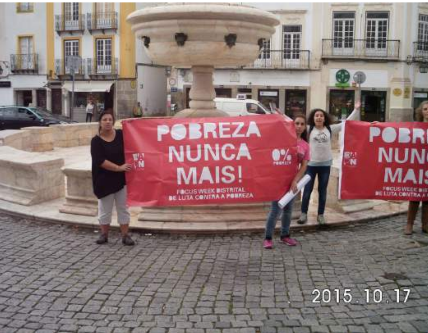
Faixas Humanas – 2015

○ Conselho Local de Cidadãos é um grupo de cidadãos que vivenciam ou vivenciaram situações de vulnerabilidade social nomeadamente, situações de pobreza e/ou exclusão social e que têm efetuado um percurso participativo que lhes permite um envolvimento empenhado e ativo no cumprimento